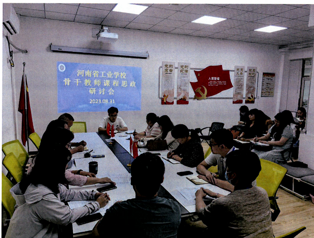
图 10 学校召开骨干教师课程思政研讨会