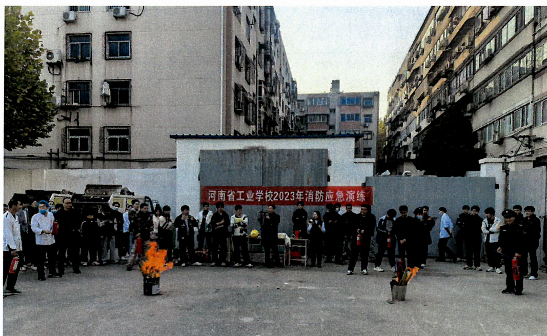
图 8 消防应急演练活动

演练开始前，河南省消防协会宣讲员王玉晶教员首先为大家介绍了常用消防安全工具的使用方法，详细对灭火器的操作方法及注意事项等进行了讲解，并做出现场示范。随后代表师生和各部门工作人员分别拿起灭火器按照操作要领进行了实际操作，大家动作到位，成功灭火，培训取得了显著效果。树立起“关注消防，生命至上”的校园安全意识，提高了学校师生的消防自救能力，加强了学校应对突发灾难事件的应急处理能力，为学校安全稳定和建设平安校园奠定了坚实的基础。