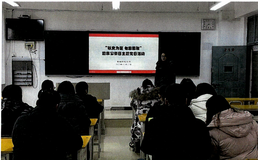
图7 基础部党支部组织国家公祭日主题党日活动