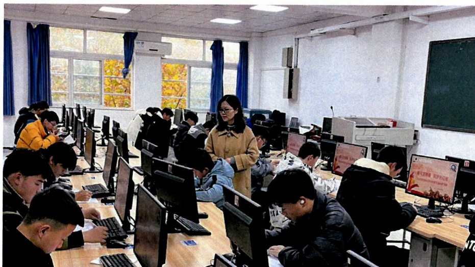
图 6 学生社团组织的 CAD 机械制图竞赛