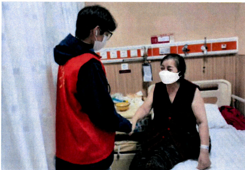
图 20 敬老爱老志愿服务