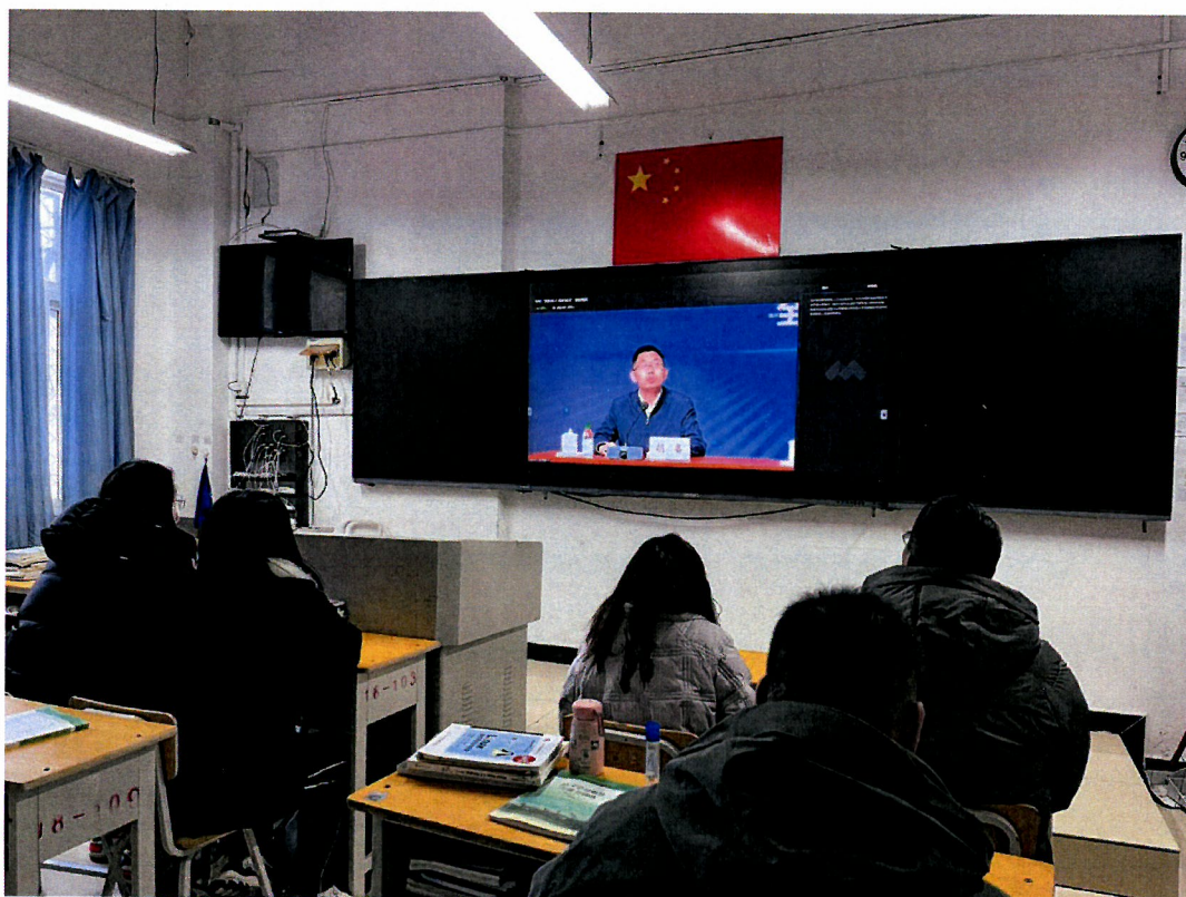
图4 学生资助管理部门工作人员参加培训

解和掌握，增强了新时代做好学生资助工作的使命感和责任感，学到了怎样对学生进行深度辅导、怎样在心理上改变学生对资助工作的抵触性，进而更加有效地帮助引导家庭经济困难的中职学生摆脱心理困扰，实现其健康成长成才。