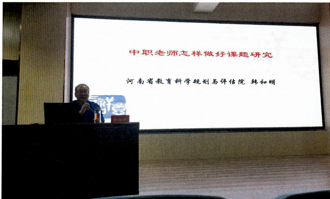
图 11 工校大讲堂活动

学校教师进行课题研究的热情非常高涨，为更好的服务教师职业发展，促进教师教学教研能力提升。学校在充分调研教师需求的基础上，组织开展了以《中职老师如何做好课题研究》为主题的新一期工校大讲堂活动。全体专兼职教师（含各校区）进行现场学习。本次活动为学校教师开展课题研究指明了方向，介绍了课题研究的全过程并分析了细节。参与活动的教师普遍反映这场活动组织得非常及时，活动内容水平高、质量好。