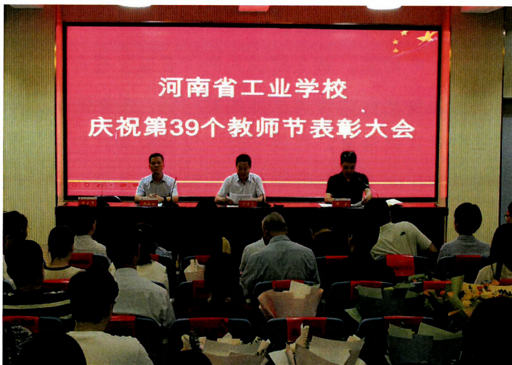
图 16 教师节表彰大会

取多种工作方法，充分利用现有资源，配合教学进行职业建设和课程改革，取得显著的成效。学校积极探索校企合作方式，拓宽视野、拓展思路，参加河南省教育厅指导的河南省高职院校第三届产教融合研讨会暨产教数字化论坛，学习产教融合专不负期盼、携手奋进，坚决扛起为党育人、为国育才的重任，为办好人民满意的职业教育、建设教育强省作出自己更大的贡献！为学校高质量发展再立新功！