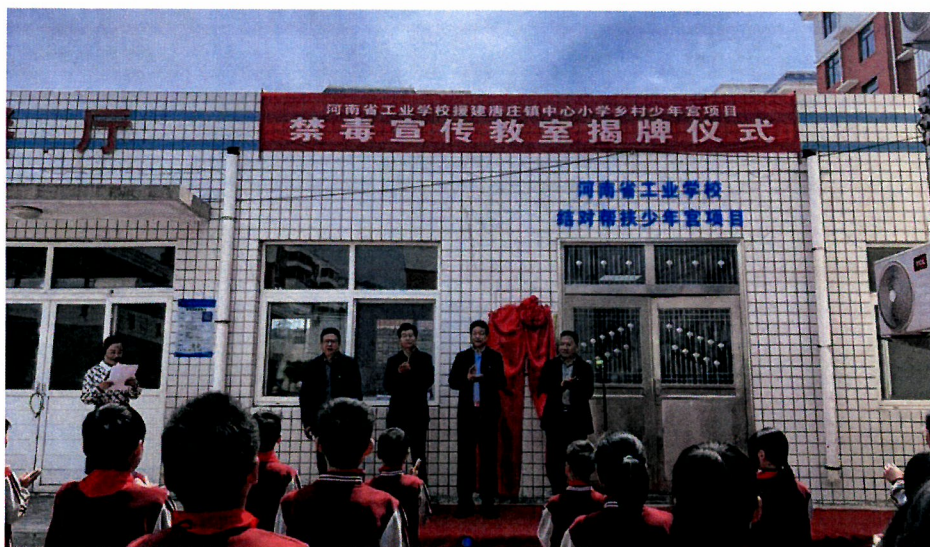
图 18 结对帮扶

积极开展结对帮扶工作。贯彻落实帮扶工作要求，与结对帮扶的登封市唐庄镇中心小学共同建设乡村学校少年宫。5月12日以“珍爱生命，拒绝毒品；阳光前行，健康人生”为主题的乡村学校少年宫禁毒宣传教室正式揭牌，为进一步深化结对帮扶工作添砖加瓦。河南省工业学校作为省级文明校园，一直致力于文明结对帮扶乡村学校少年宫建设工作，多次到中心小学开展交流活动，为中心小学提供教学设备、师资培训、文体器材、防疫物资等支持。