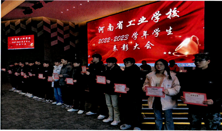
图 17 新能源汽车产教融合基地学生表彰大会