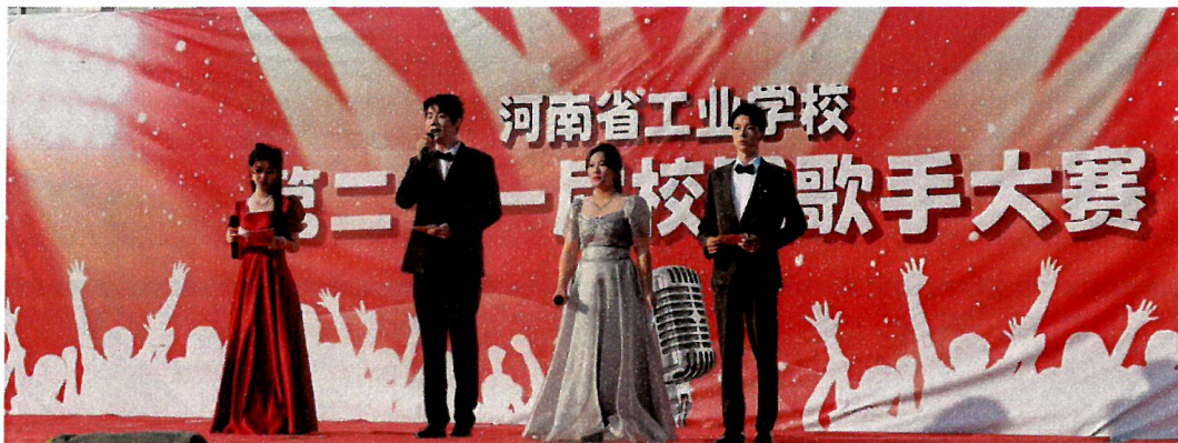
图 5 第二十一届校园歌手大赛