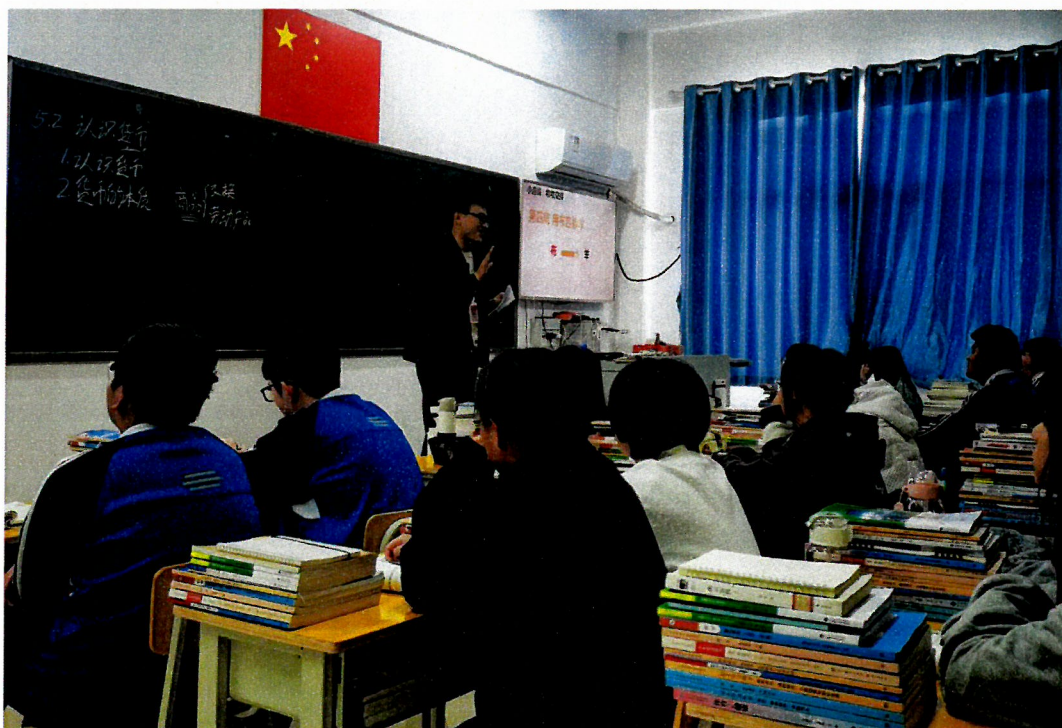
图 13 公开课教学活动

为进一步深化教学改革，提高教师核心教学能力和专业素养，助力教师成长，打磨课堂教学基本功，学校经济管理系组织开展了公开课教学活动。本轮公开课为教师创造了展示自我的机会，也是教师成长的平台。各位教师深入钻研教学内容，创新教学手段和方法，在课堂上进行检验，课后各位老师及时反馈教学亮点和不足，授课老师及时进行教学反思，不断完善自己。深耕课堂，观摩学习，惟精惟专，孜孜以求，致力职教。