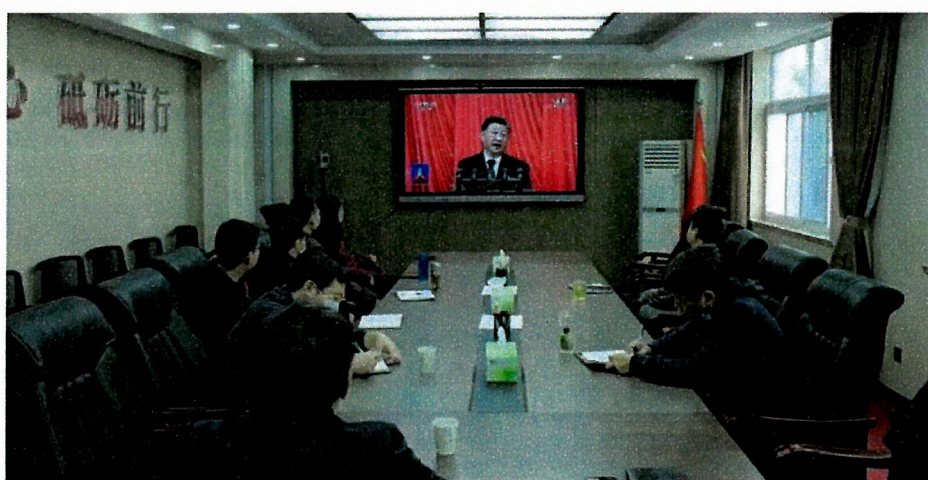
图 14 校领导班子成员观看二十大开幕会直播

全校干部职工和学生纷纷表示通过学习领会二十大报告，提高了认识、增添了干劲。要以高度的政治责任感、饱满的学习热情，认真学习、宣传、贯彻好党的二十大精神，进一步把思想和行动统一到二十大的要求和部署上来，紧紧围绕中心任务，自信自强，守正创新，踔厉奋发，勇毅前行，努力践行肩负的重大责任和光荣使命，奋力谱写新时代河南教育更加出彩的绚丽篇章！