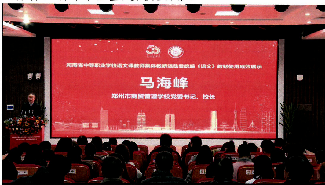
图 12 语文课教师参加集体教研活动

“教乃研之基础，研乃教之利器”。老师们纷纷表示，此次教研活动既有精彩的课本剧展示，又有巧聚智慧的思想碰撞，更有深度的高瞻引领，让他们收获颇丰；他们将把所学积极运用到自己的教学中去，助力学生提升语文核心素养，引导学生坚定文化自信。