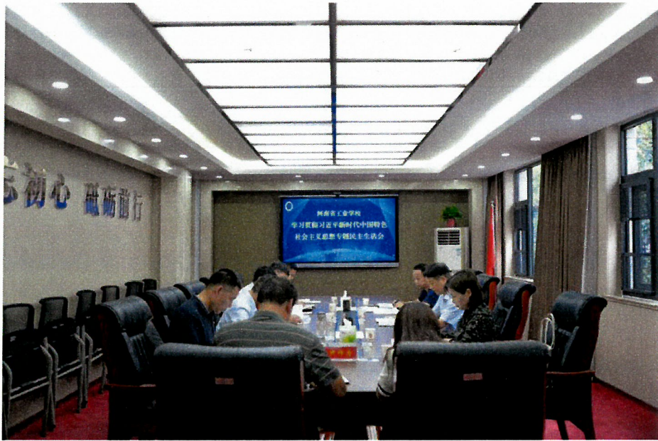
图 15 民主生活会