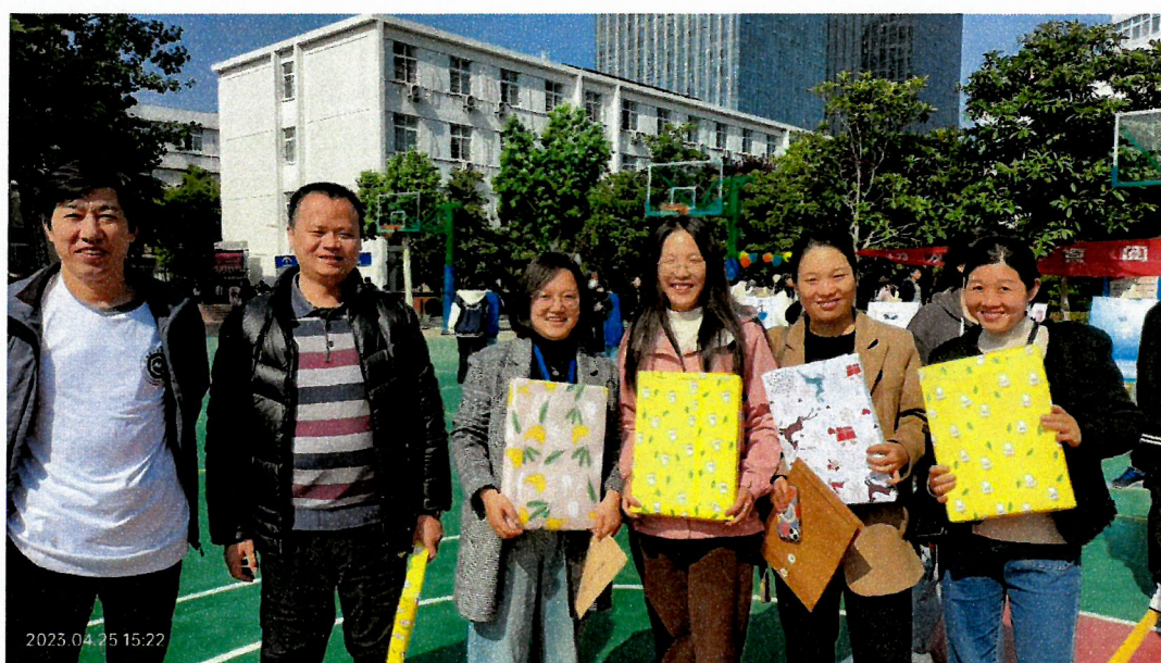
图 1 集赞有礼活动

主题活动。陆续开展了书香班级、借阅之星评选、寻找工校最美朗读者、集赞有礼活动。旨在培养学生的阅读习惯，通过读书闪耀自己、照耀他人。同时展现学生丰富多元的青春激情，用最平实的情感读出文字背后的价值，展现有血有肉的真实人物情感，感受到朗读的快乐和魅力。